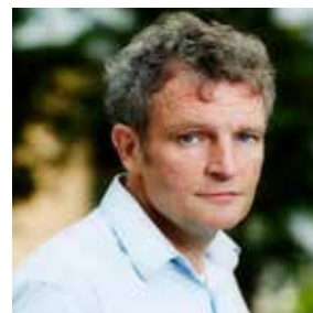
Floris Alkemade (Rijksbouwmeester)